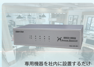
専用機器を社内に設置するだけ

楽々セキュアコネクトは 現在ご利用中のインター ネット回線や機器はその まま！驚くほど簡単にテ レワーク環境 (VPN) を実 現するサービスです。